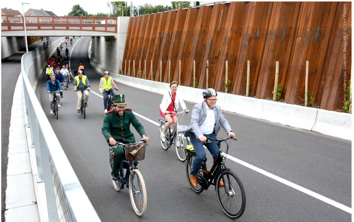
Railway underpass, Lokeren, Belgium